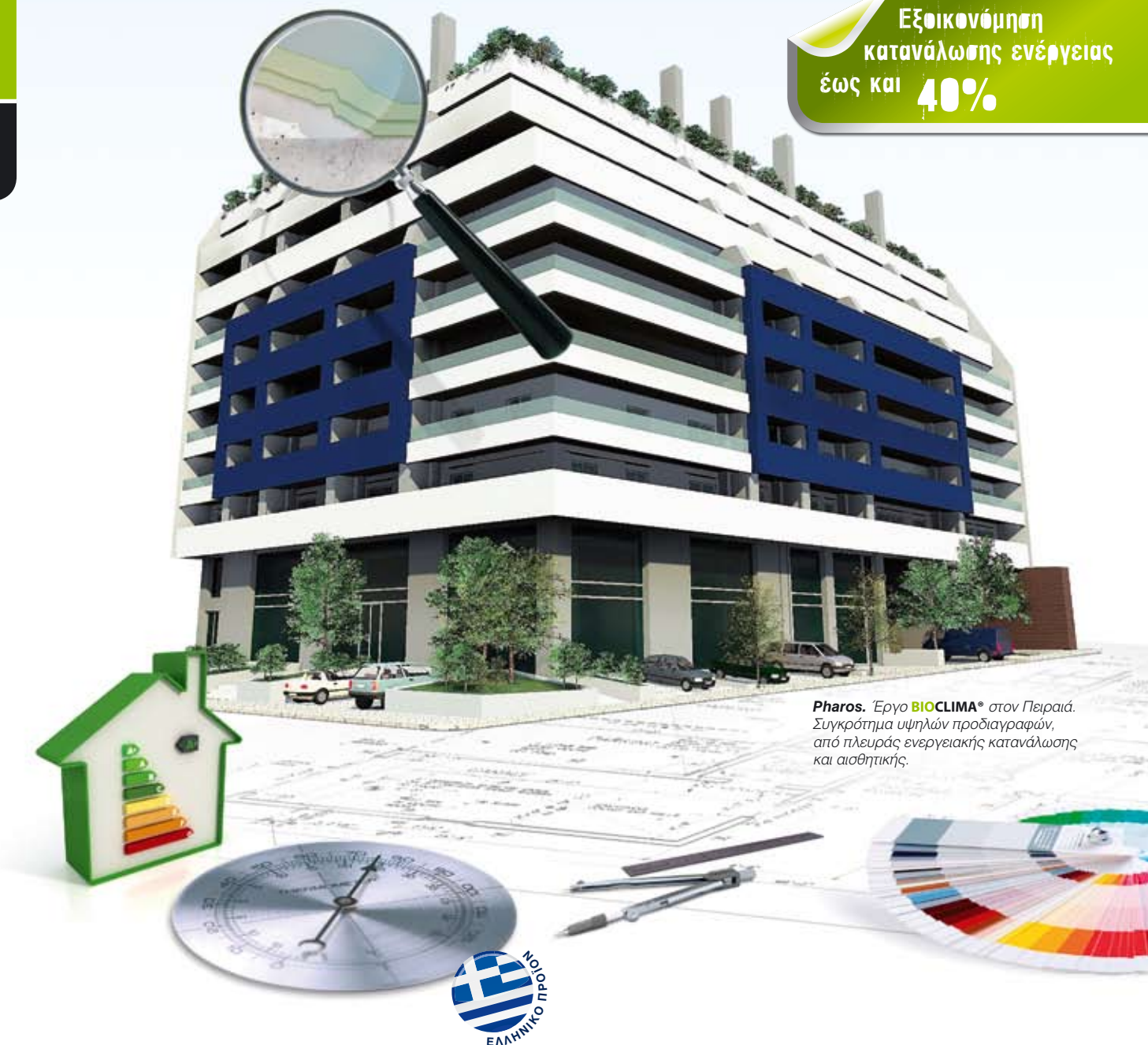
Pharos. Έργο BIOCLIMA® στον Πειραιά. Συγκρότημα υψηλών προδιαγραφών, από πλευράς ενεργειακής κατανάλωσης και αισθητικής.

Εξοικονόμηση κατανάλωσης ενέργειας έως και 40%